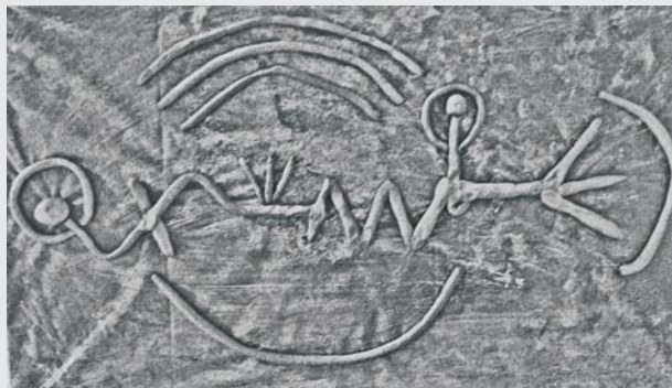
Plastische Darstellung des Lebenslauf eines Klienten

Eine Unterstützung, das eigene Leben selbst in die Hand zu nehmen und in seiner Gesamtheit zu begreifen.